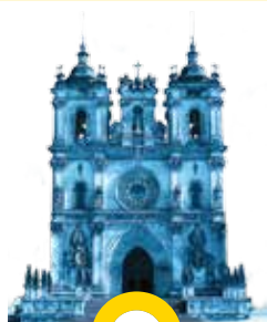
Mosteiro de Sª Maria ALCOBAÇA