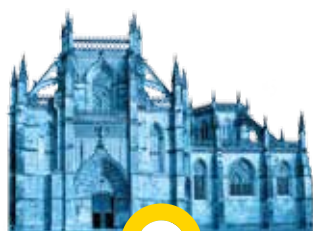
Mosteiro de Sª Maria da Vitória BATALHA