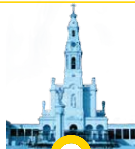
Santuário de Fátima FÁTIMA