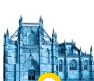
Mosteiro de Sª Maria da Vitória BATALHA