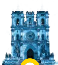
Mosteiro de Sª Maria ALCOBAÇA