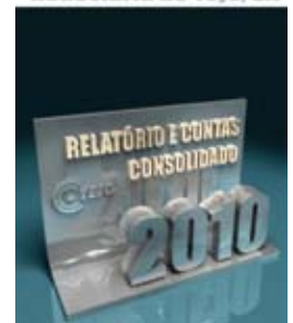
Rodoviária do Tejo, SA